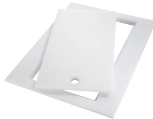
Planche de découpe Twin in HDPE 8644 101