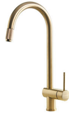
VOLTA GOLD 8491 109