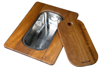
Planche de découpe Twin en bois Iroko avec tamis en acier inoxydable 8644 044