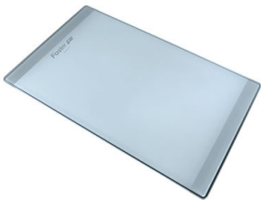
Planche de découpe en verre 8631 300