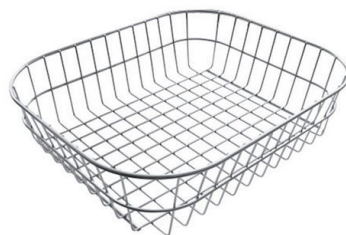
Panier en acier inoxydable 8611 000