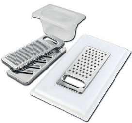
Kit râpes avec anneau de support et cuvette 8159 101 * uniquement en combinaison avec l'accessoire 8644 101