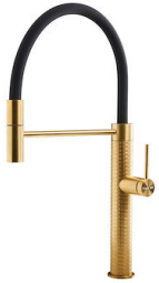
Mitigeur Skin Gold 8424 859