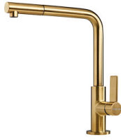
VELA PLUS GOLD satiné 8498 129